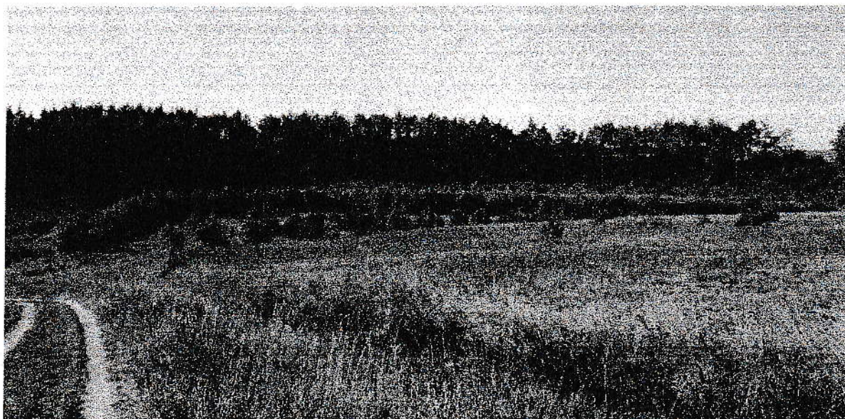
Zdj. 1 Widok od strony drogi dojazdowej na teren objęty zakresem opracowania

Mając na uwadze istniejące zagospodarowanie w przedstawionych lokalizacjach, ingerencja w środowisko naturalne nie przekroczy aktualnych norm. Realizacja przedmiotowej inwestycji nie wymaga wycinki drzewostanu na analizowanych działkach lokalizacyjnych.