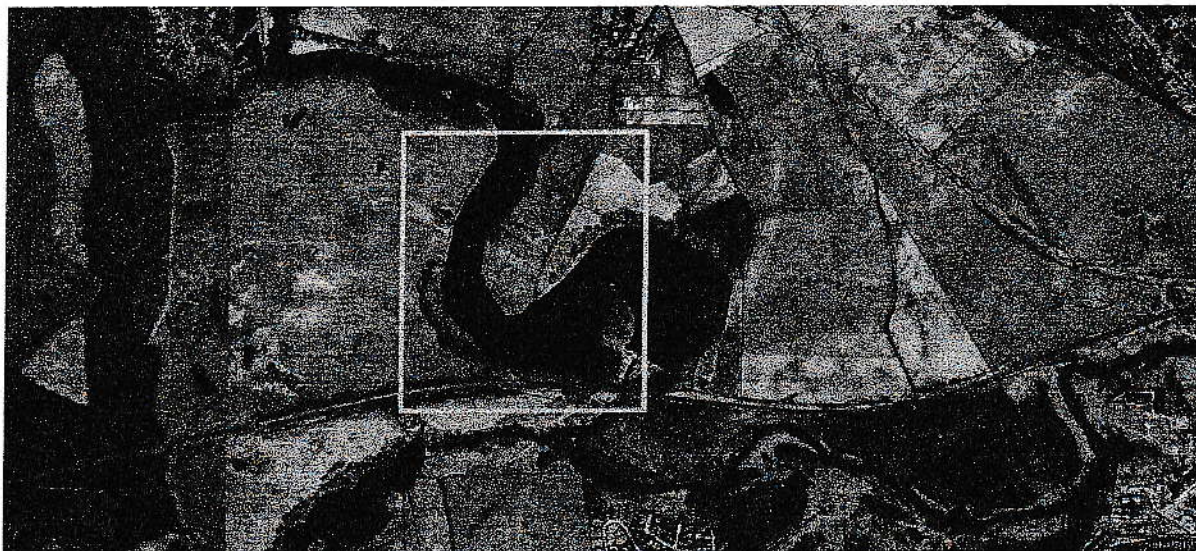
Rys 1.3 Mapa sytuacyjna określająca położenie inwestycji w- Żabnie na tle istniejącej struktury własnościowej

Działki 56, 51/4, 51/5 i 51/9 położone są w miejscowości Żabno, nad rozlewiskiem, będącym skutkiem budowy elektrowni wodnej Wierzyca. Dostępność transportowa lokalizacji jest utrudniona, ze względu na zły stan nawierzchni drogi dojazdowej oraz znaczne spadki terenu w kierunku rozlewiska.